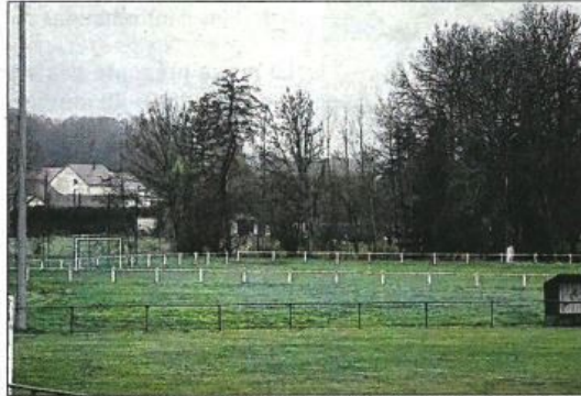
Le terrain de bicross pourrait être situé entre les deux terrains de football.

Auparavant, il existait un site similaire sur la route de Premières, qui était devenu un point de rencontre de nombreux jeunes, mais qui avait été détruit sous l'ancienne municipalité. Léo Brégégère, le maire du conseil municipal des Jeunes, a avancé qu'il serait possible d'en aménager un sur le triangle qui sépare les deux terrains de football. Des