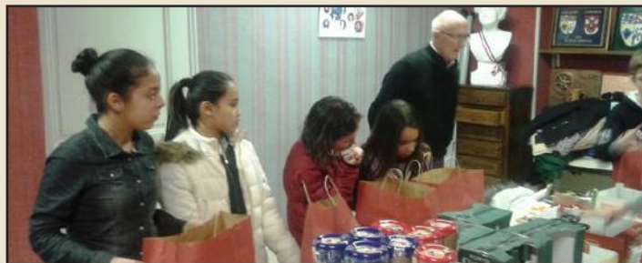
■ Les jeunes du CMJ ont préparé des colis de Noël.